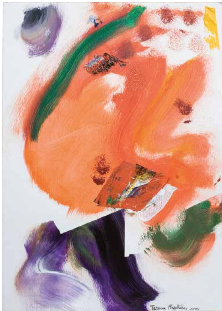
Sem título — 2004 Acrílico s/ papel 30 x 21 cm