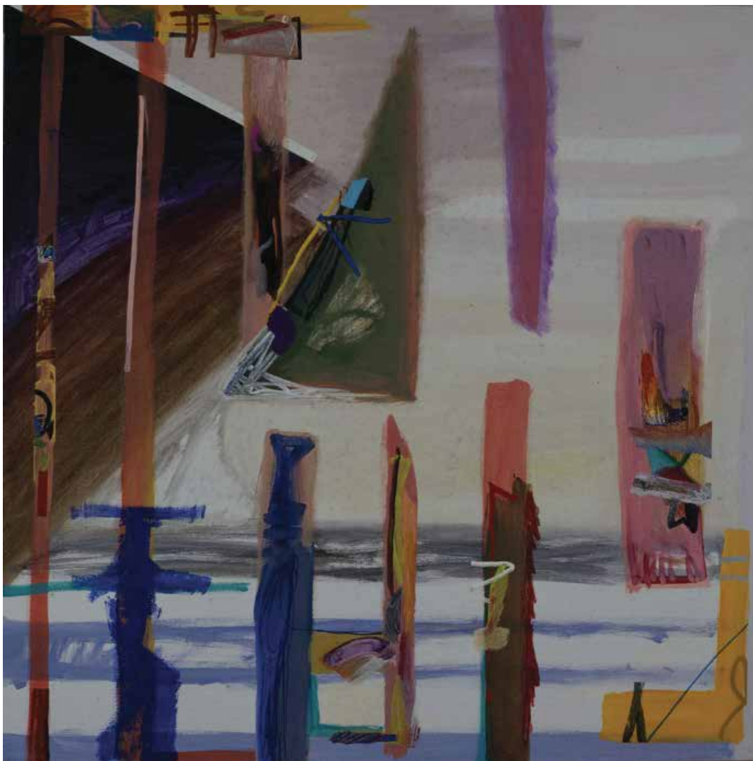
Sem título — 1993 Acrílico s/ tela 140 x 140 cm