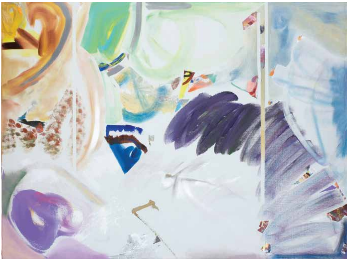
Sem título — 2003 Acrílico s/ tela 117 x 156 x 7 cm