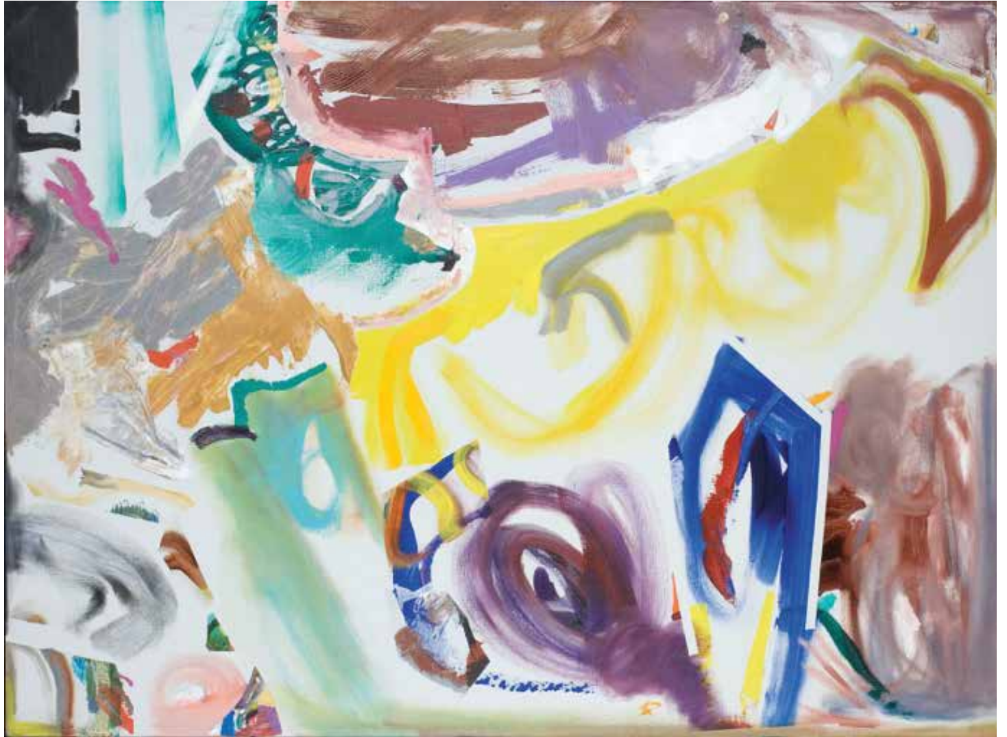
Sem título — 2003 Acrílico s/ tela 117 x 156 x 7 cm