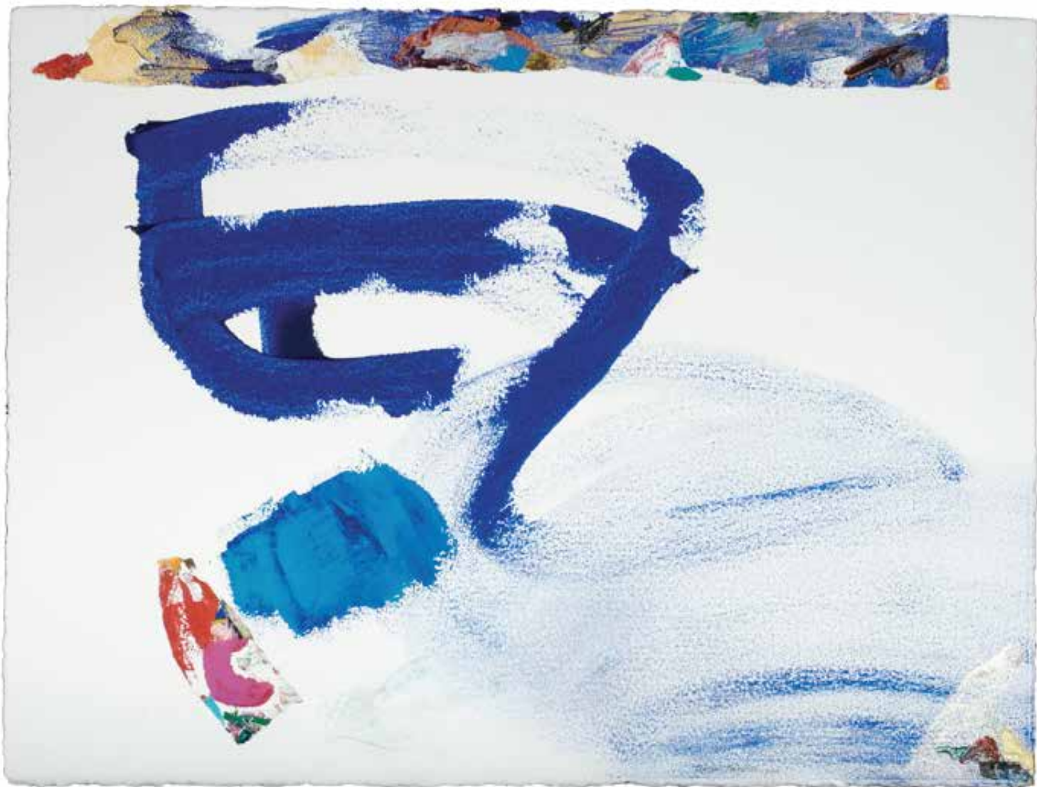
Sem título — 2003 Acrílico s /papel 57 x 78 cm