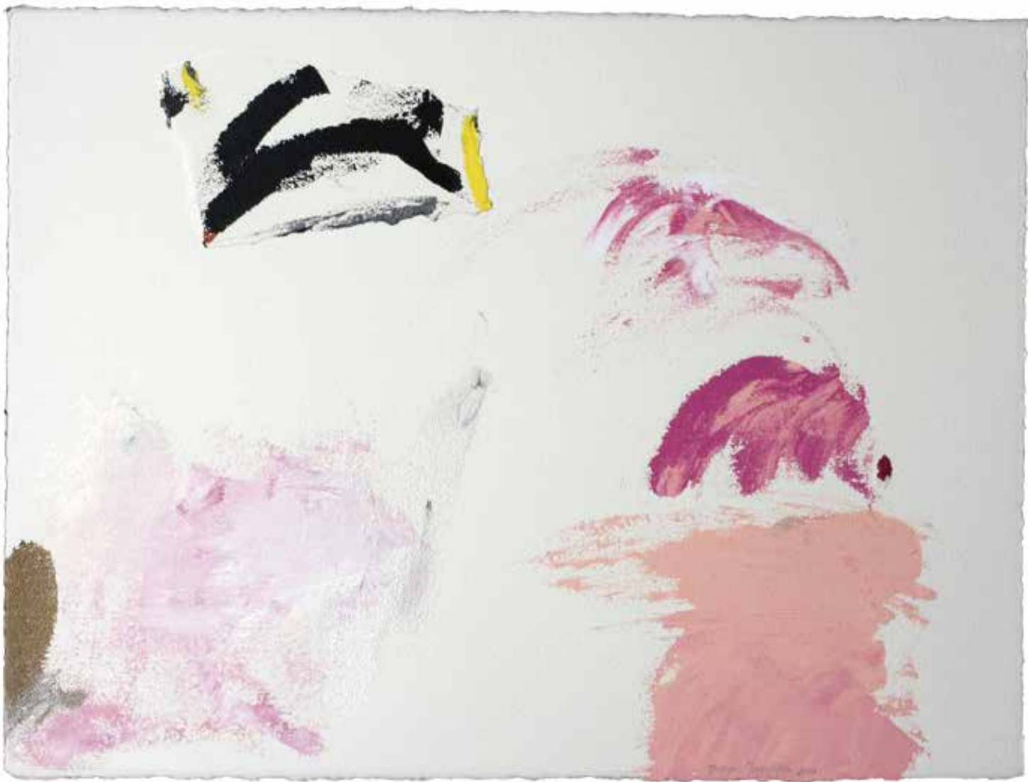
Sem título — 2003 Acrílico s/ papel 57 x 78 cm