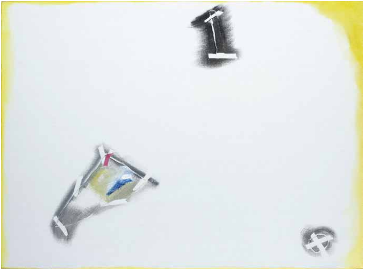
Sem título — 2003 Acrílico s/ tela 88 x 117 x 7 cm