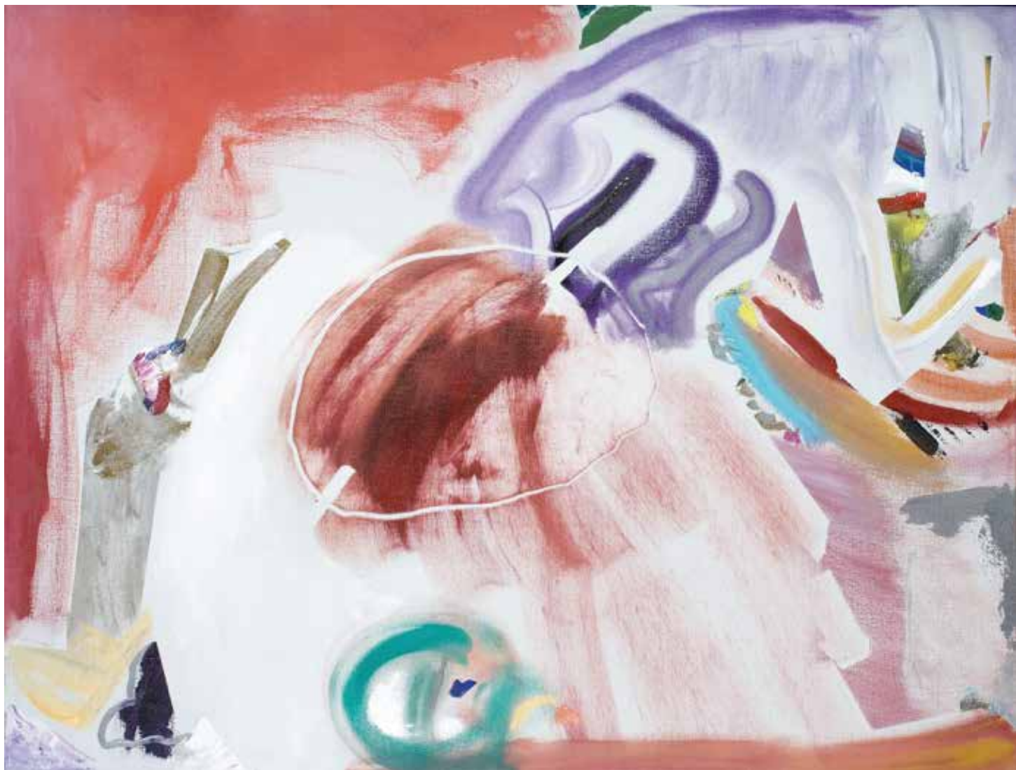
Sem título — 2003 Acrílico s/ tela 88 x 117 x 7 cm