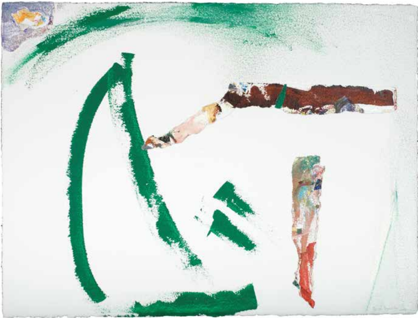
Sem título — 2003 Acrílico s /papel 57 x 78 cm