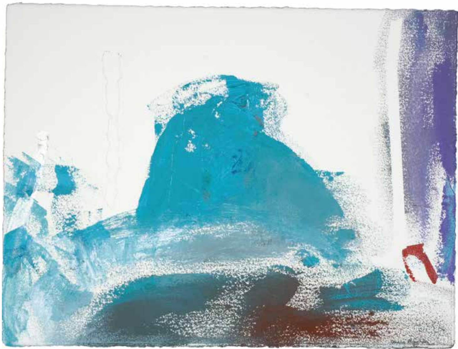
Sem título — 2003 Acrílico s/ papel 57 x 78 cm