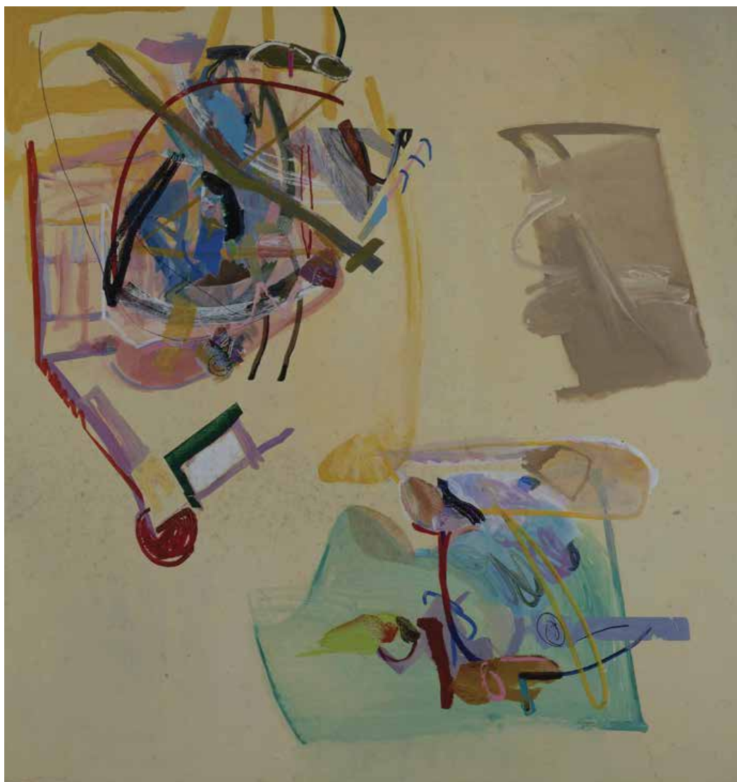
Sem título — 1993 Acrílico s/ tela 140 x 140 cm