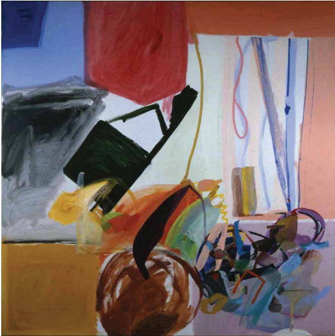
Sem título — 1993 Acrílico s/ tela 140 x 140 cm